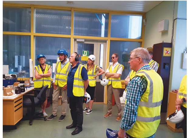
Komisio Kemijoki Oy:n vieraana Taivalkosken voimalai- toksella 28.kesäkuuta.

Kokous pidettiin Rovaniemellä Santa Claus-ho- tellissa. Edellisenä päivänä tutustuttiin Kemijoki Oy:n Taivalkosken voimalaitoksen kalauoman suunnitelmiin, jonka lupahakemus oli jätetty al- kuvuodesta.