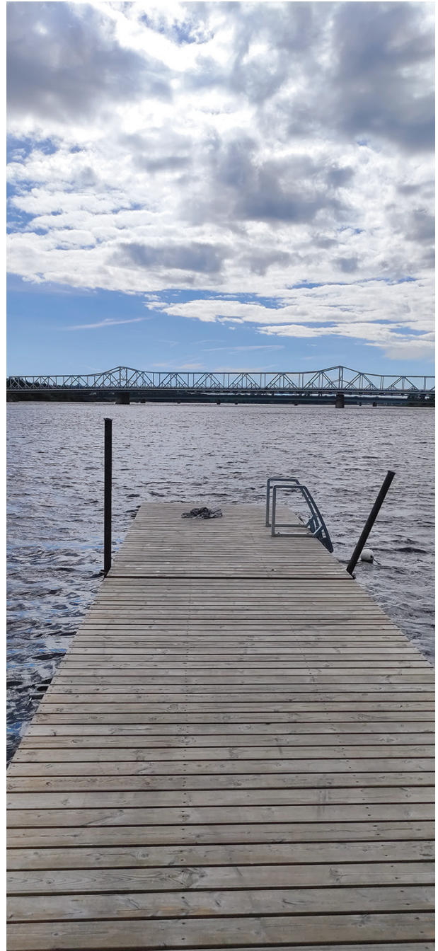
Tornionjoki ja Tornion Pikisaaren laituri.

Ministeriö esittää, että lohien kalastukseen kulku-