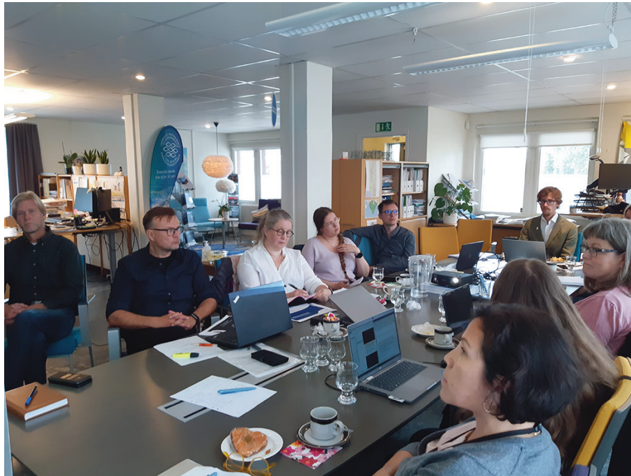
Maankäyttökokous lääninhallituksen, Lapin Ely-keskuksen ja kuntien virkamiesten kanssa kansliassa elokuussa.

Seuraavalla sivulla on listaus kokouksista, joissa komissio on ollut sidosryhmänä mukana.