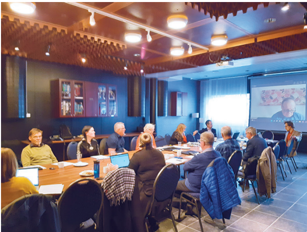
Komission kokous Torniossa 15. syyskuuta.

Aluksi nähtiin esitys rajat ylittävästä EU Triwa LIFE-hankkeesta. Toimenpiteet, kuten Tornionjoki-alueen sivujokien ennallistaminen ovat sen ohjelmassa. Hankkeen rahoitus on varmistunut.