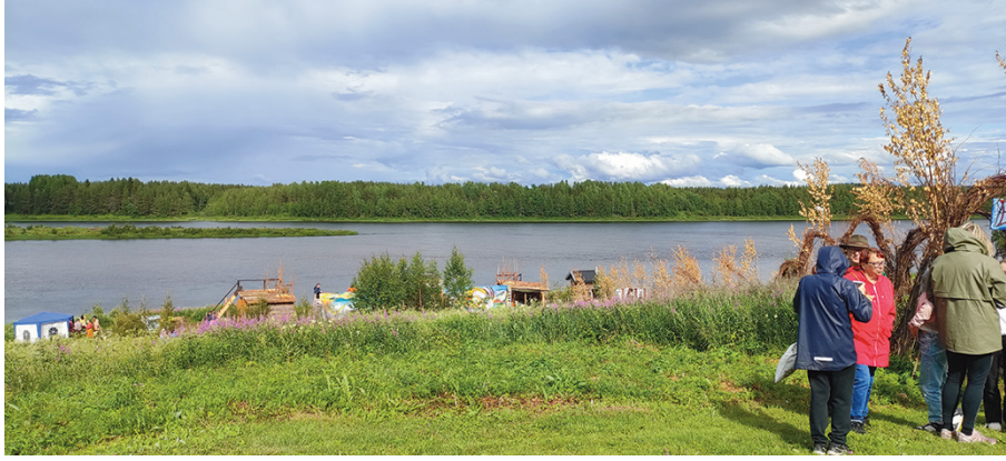
Den lycklige laxen -musikaali sai komissiolta rajajokiavustusta.