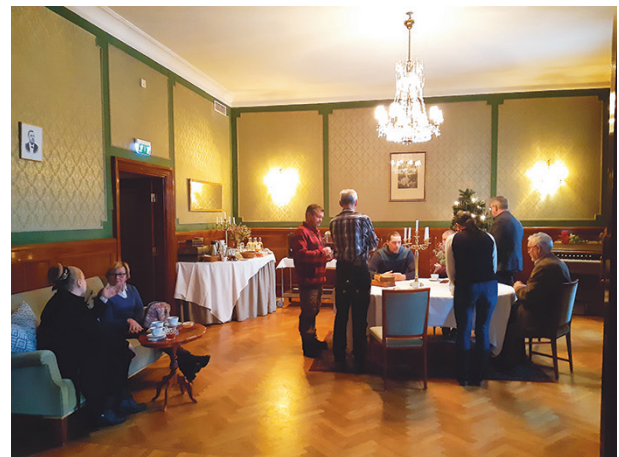
Komission joulukokous oli jo 25. marraskuuta, paikkana Haaparannan perinteikäs kaupunginhotelli.