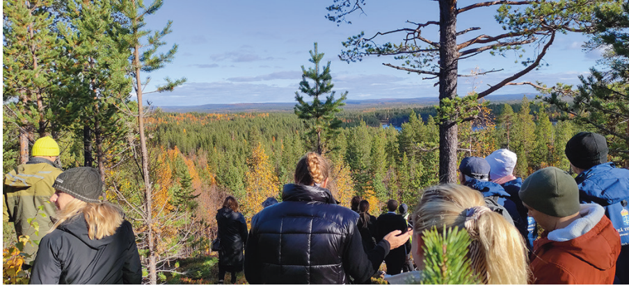
Uumajan käräjäoikeuden maastokatselmus Vittangissa keräsi sekä viranomaisia, mediaa että paikallisia asukkaita maastoon.